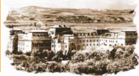
TÂRGU-MUREȘ 1919 -1940